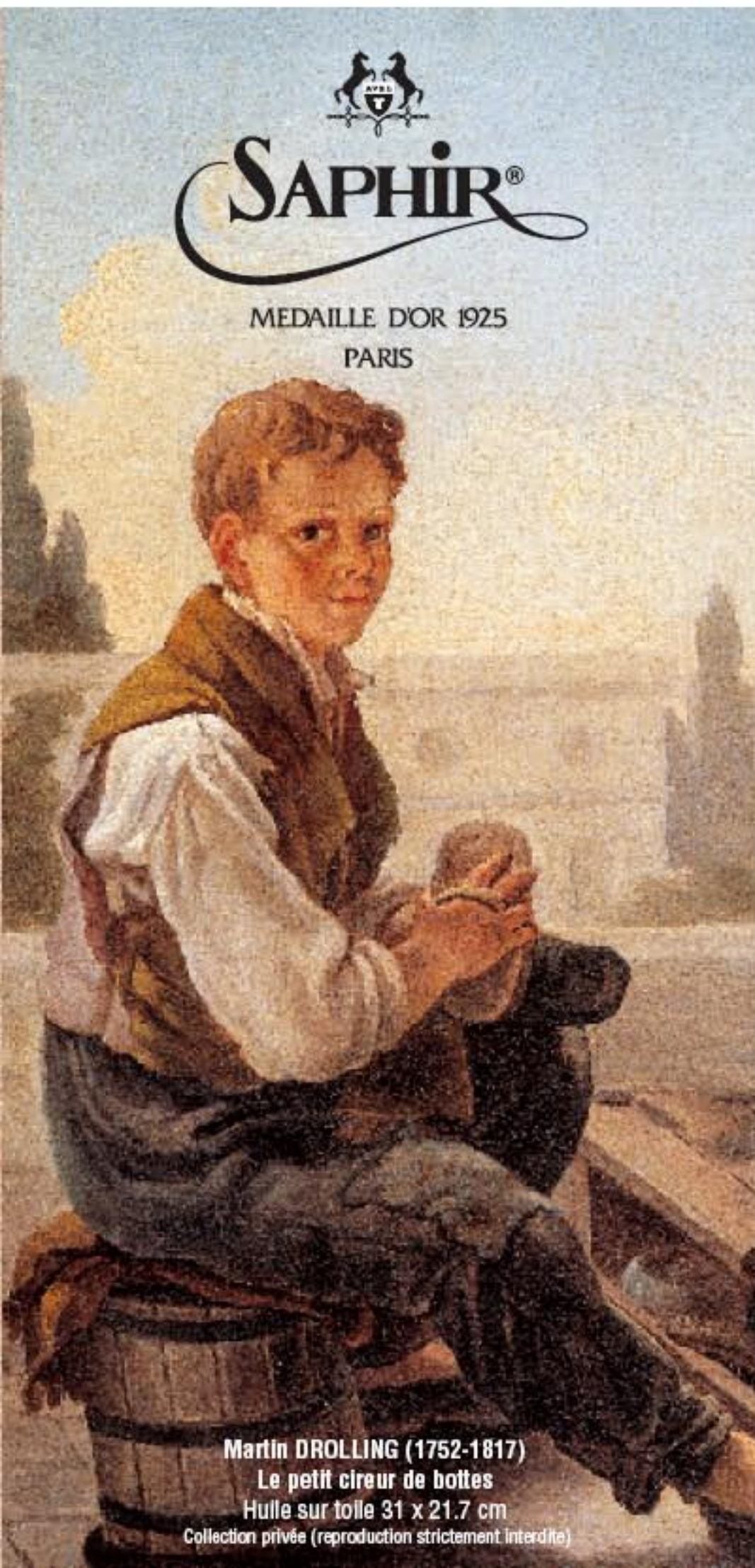
Martin DROLLING (1752-1817) Le petit cirieur de bottes Huile sur toile 31 x 21.7 cm Collection privée (reproduction strictement interdite)